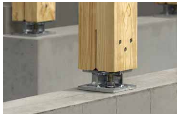
積水ハウス「基礎ダイレクトジョイント」