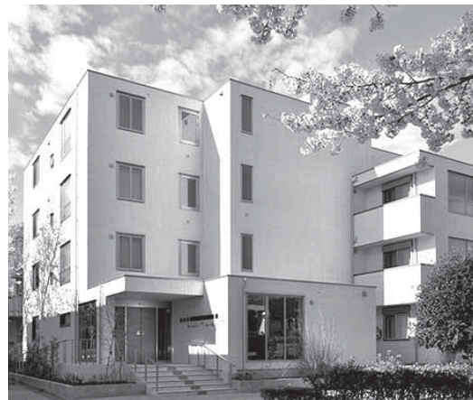
お部屋探し(シニア向け)