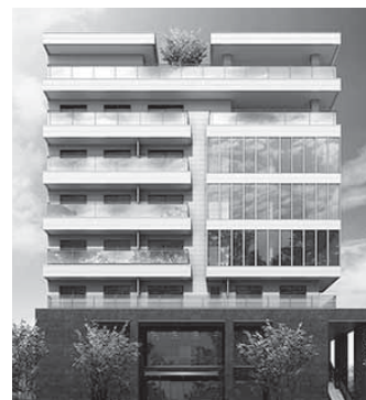
中高層ビルディング

超高齢社会のニーズを捉えた 賃貸住宅経営。 土地活用をととして社会に 貢献できます。