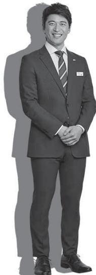
体感すまいパーク柏