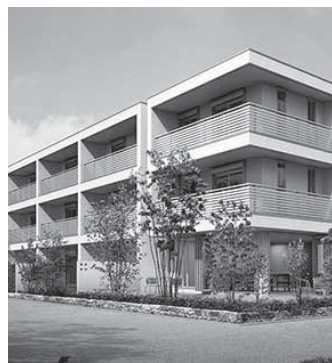
賃貸住宅(シニア向け)

高い防災力をもつ安全安心な 賃貸住宅経営。 狭小の住宅地から大規模な 敷地まで対応可能です。