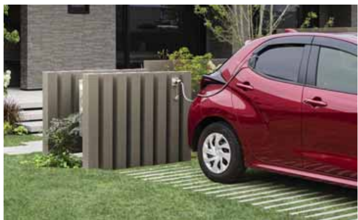
トヨタホーム「クルマde給電」