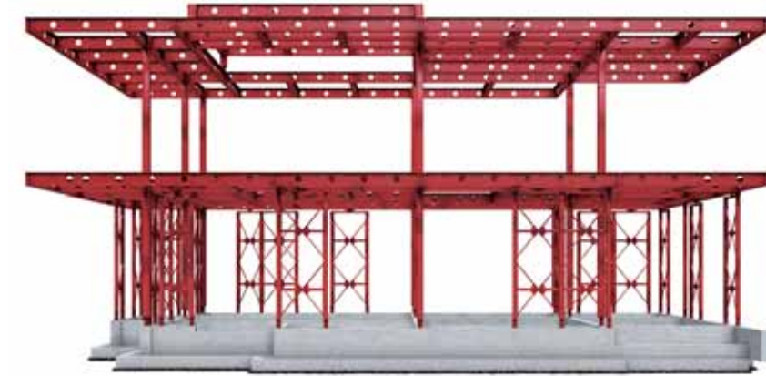
旭化成ホームズ「重鉄制震・デュアルテックラーメン構造」

地震あんしん保証は「制震重鉄ハイブリッド構造、制震鉄骨軸組構造、大型パネル構造の耐震等級3を有する居住用建物」が対象。計測震度6・8以下の地震の揺れによる建物の全壊、大規模半壊、半壊時に1棟あたり、建物価格または5千万円のいずれか低い金額を保証する。 通常の地震保険の保証が時価であったり、2千万円程度だったりに対し、ほぼ全額保証する制度は震災後の生活が勇気づけられそうだ。